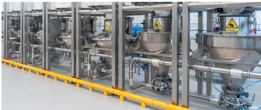
Vyprazdňovací stanice BIG-BAGŮ

bylo také prověření a vylepšení logiky pro povinné přestávky na suché čištění mezi výrobami, což je zásadní pro eliminaci rizika křížové kontaminace alergenů.