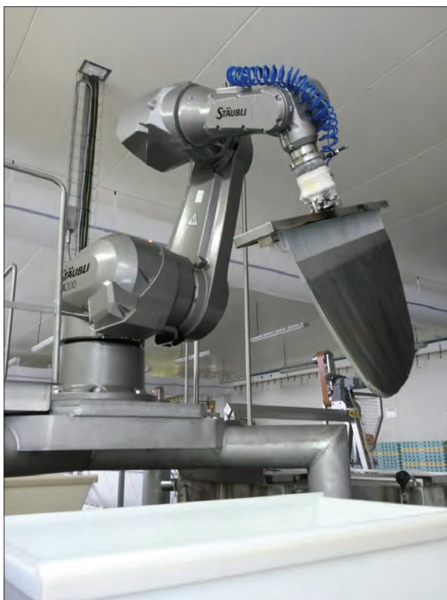
Obr. 1. Využití robotu Stäubli v potravinářském průmyslu

s automatizovanými stroji a linkami, má výrobní podnik mnoho možností, jak nedostatkovou a v Evropě stále dražší lidskou práci nahradit, udržet svou konkurenceschopnost